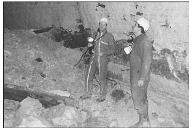
GAGNY, FEVRIER 2000. Deux techniques s'opposent pour combler ces galeries qui ont commencé de s'effondrer.

Comblé, on ne demande que ça. Sauf qu'on n'arrive pas à se mettre d'accord sur la technique à adopter. La moins onéreuse consiste à remblayer de l'intérieur. On prend un bulldozer et on pousse les gravats jusqu'au fond des galeries. Cette méthode a des limites : elle ne permet pas de remplir jusqu'en haut de la voûte. La seconde technique consiste à réaliser des forages et à remplir par le haut, selon le principe du sablier. L'inconvénient est que le prix est beaucoup plus élevé. Pour le directeur des services techniques de la ville, la première méthode suffirait pourtant pour la partie destinée aux