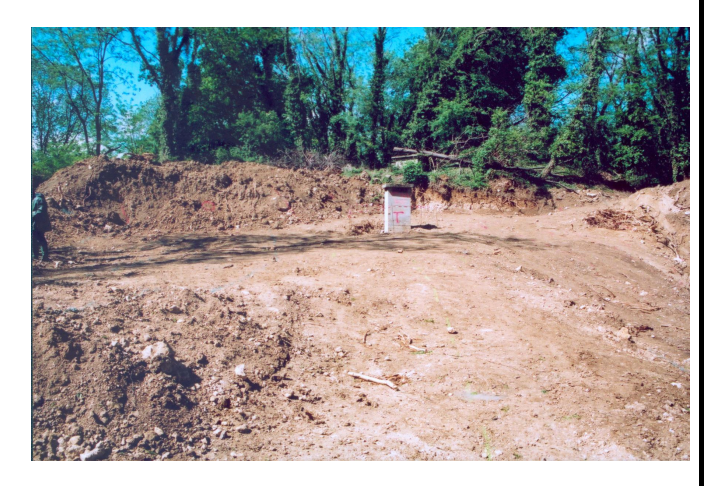
Zone CA 14 après décontamination / fort central de Vaujours