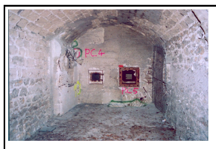
Poste TC1, points chauds PC4 et PC5 identifiés par la CRIIRAD