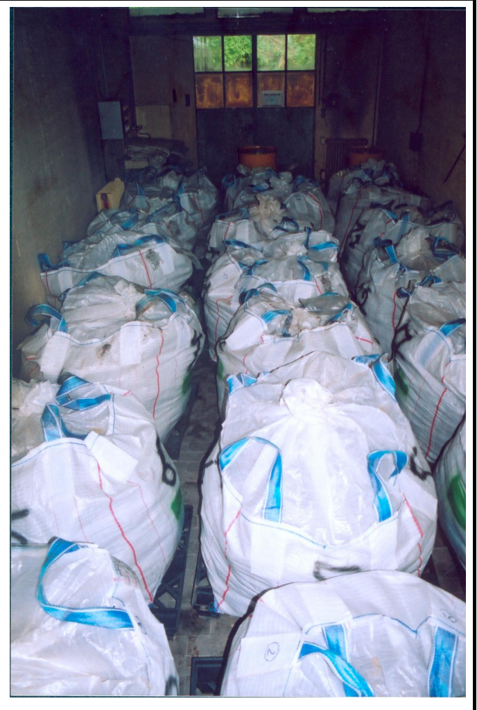
Entreposage provisoire de terres contaminées issues de la zone CA 14.