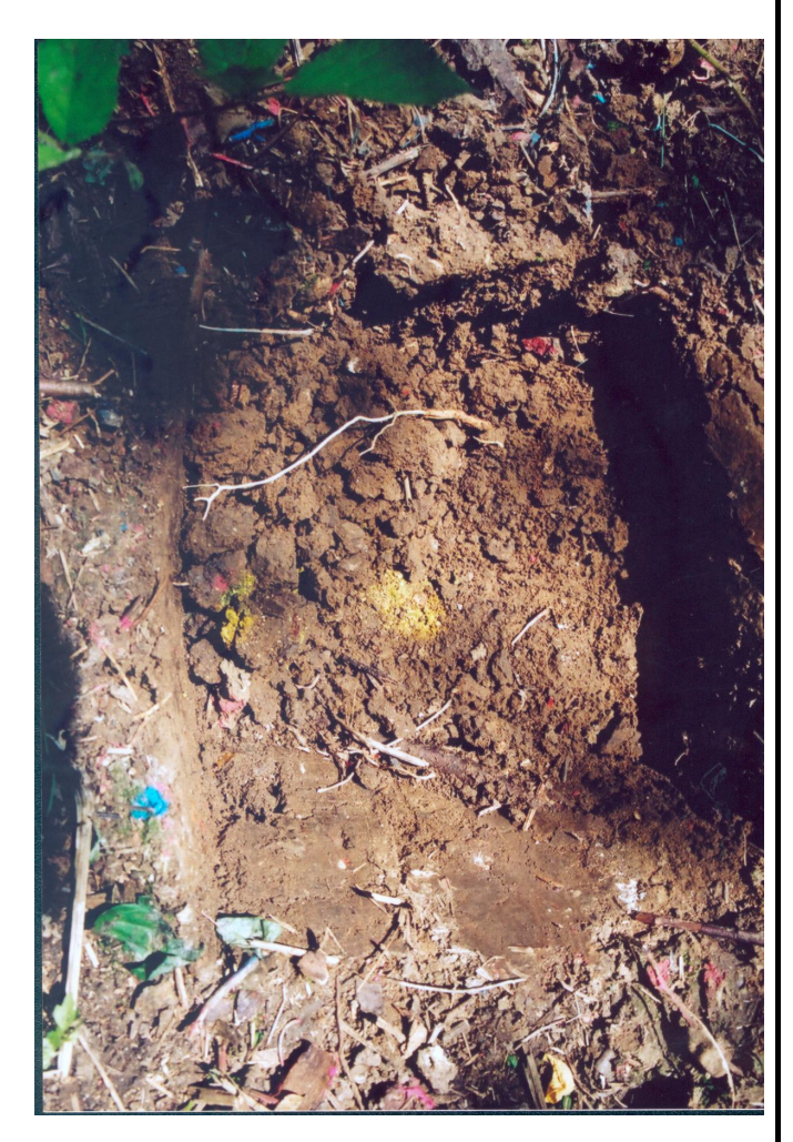
Présence visible d'oxyde d'uranium (jaune) dans les sols du fort central à Vaujours

impose une réflexion sur les possibilités de contamination à long terme des eaux souterraines.